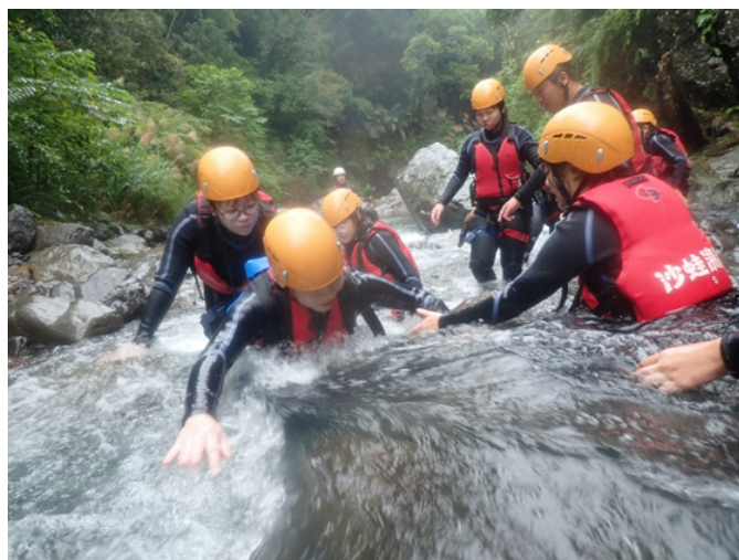
體驗教育營隊～溯溪挑戰逆流而上