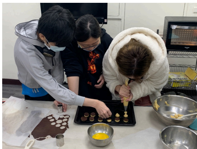
烹飪課～從材料變成美食的關鍵時刻