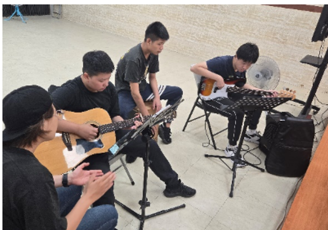
音樂課～學習不同樂器創造出跳動音符