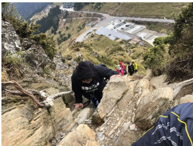
體驗教育營隊～爬山抵達人生高峰