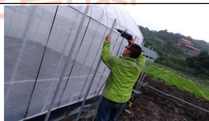
工作體驗-溫室搭建