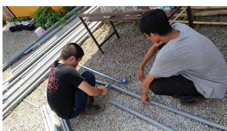
工作體驗-水管切割