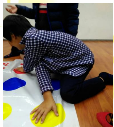
肢體與顏色的對話